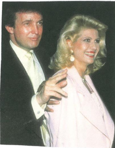
24. ÜHINE PEREKONNANTMI?