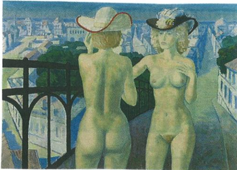
26. KUNSTNIK? (2 MAALI)